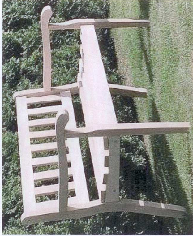
ŁAWKA TYP „A-2”