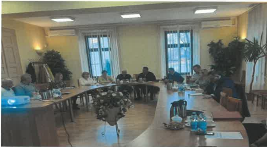
Rysunek 3. Dokumentacja fotograficzna z odbytych spotkań.