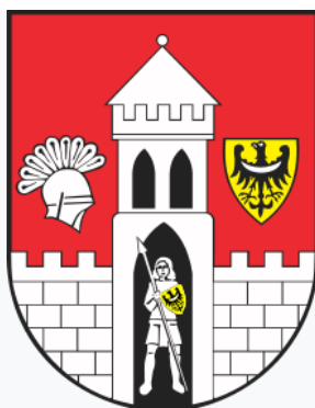
Obecny herb Żagania