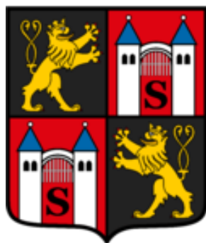
Herb używany w okresie 1602-1968.