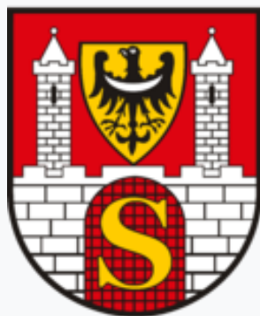
Herb używany w okresie 1945–1968